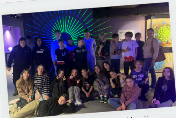
Kl. 6a - Muzeum Grawitacji