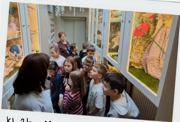
Kl. 2b - Muzeum Miasta Piastowa