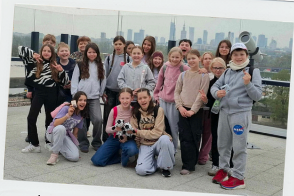
Kl. 4b - Fabryka Wedla