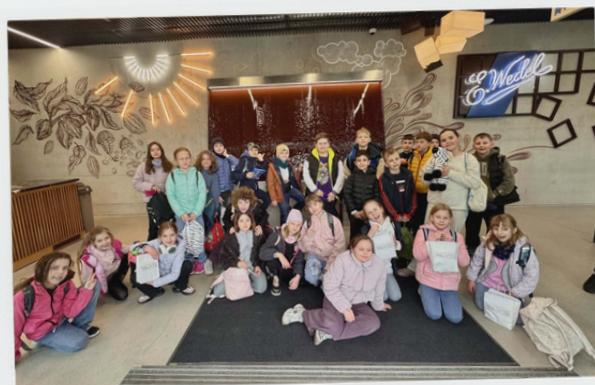
Kl. 3b - Fabryka Wedla