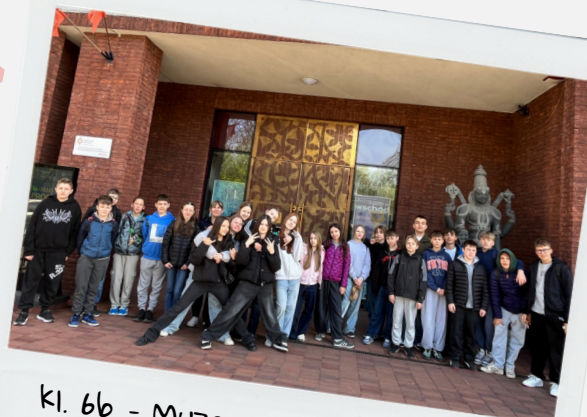
Kl. 6b - Muzeum Azji i Pacyfiku