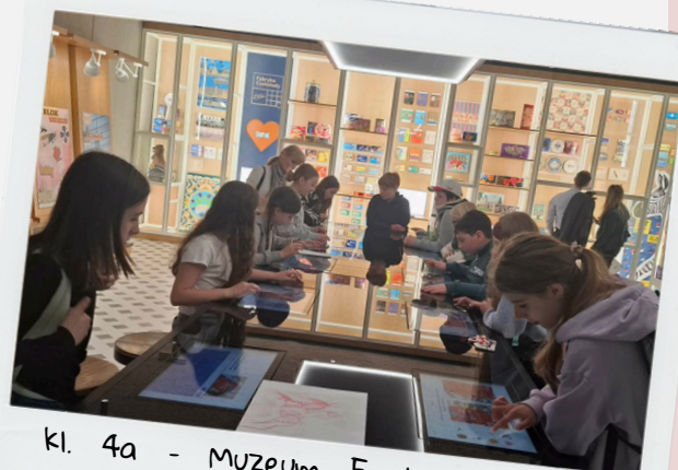
Kl. 4a - Muzeum Ewolucji + taras widokowy PKiN

Najczęściej wybierane były muzea – Miasta Piastowa, Ewolucji, Grawitacji czy też bardziej nietypowo – Muzeum Azji i Pacyfiku. Część grup udała się na Niewidzialną Wystawę, do Minicity czy do Polskiego Radia, a inni zgłębiali tajniki produkcji czekolady w Fabryce Wedla. Takie wycieczki to wyjątkowo przyjemny sposób na naukę.