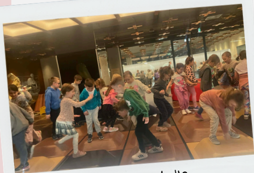
Kl. 0b - Fabryka Wedla

Tradycją naszej szkoły są wyjścia klasowe do miejsc kultury, organizowane w czasie tzw. Tygodnia Mediów. Tym razem klasy ósme musiały zrezygnować z wycieczek ze względu na próbne egzaminy, ale młodsi uczniowie korzystali z wielu różnych atrakcji i pięknej pogody.