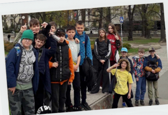
Kl. 5a - Polskie Radio