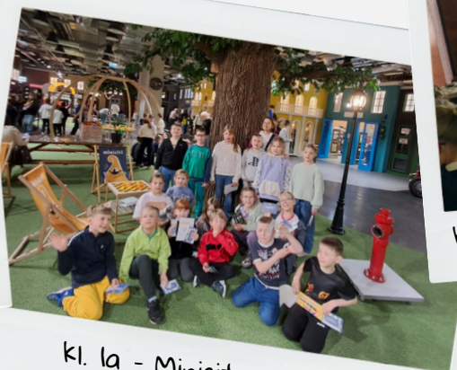
Kl. 1a - Minicity